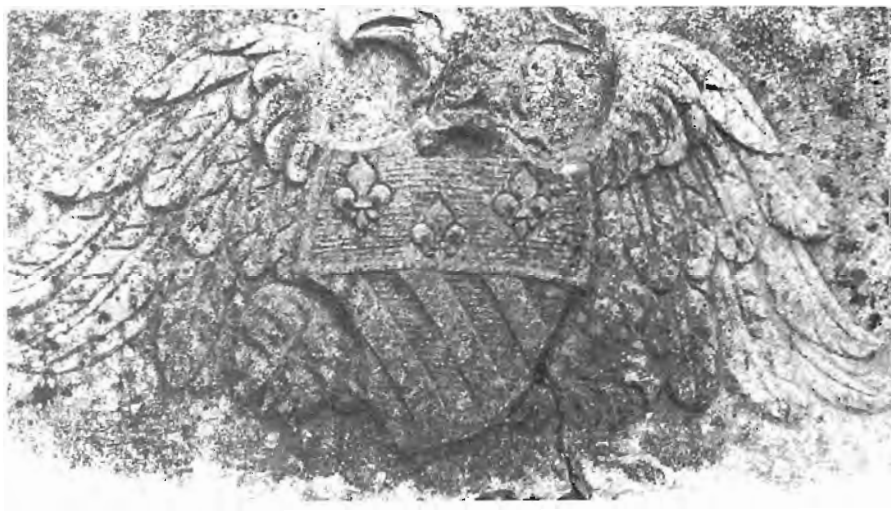
Les armes des Costa de Beauregard. Elles sont d'azur à trois bandes d'or au chef de France