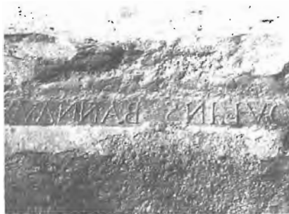
Inscription sur une maison de Vaisselets

En 1839, la population de 660 habitants est répartie en 8 hameaux. Elle est généralement tranquille. Disputes et procès sont rares. Il y avait chaque année des émigrations : les jeunes personnes partent pour Lyon