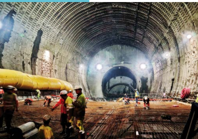
Chantier Lyon-Turin – chambre de montage du tunnelier

Un contrat de 40,7 M€ , répartis entre les signataires et les porteurs de projets.