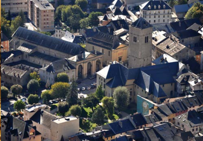
Saint-Jean-de-Maurienne vue de Bonne Nouvelle