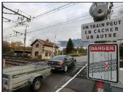
Le passage à niveau de Viviers-du-Lac est situé dans un virage, et en pente.

Dans le cadre du projet de suppression du passage à niveau n° 18 de Viviers-du-Lac, le conseil départemental et SNCF Réseau vont organiser une concertation publique entre le 4 novembre et le 6 décembre. Une réunion publique se tiendra sur ce sujet lundi 25 novembre à 18 h 30, à la salle Henri-Blanc de Viviers-du-Lac. Le dossier de concertation sera disponible en mairie et sur le site internet du Département ( www.savoie.fr ). Chacun pourra faire part de ses remarques et de ses suggestions sur le registre mis à disposition en mairie (aux heures d'ouverture). Le passage à niveau de Viviers-du-Lac est régulièrement présenté comme l'un des plus dangereux d'Auvergne-Rhône-Alpes.