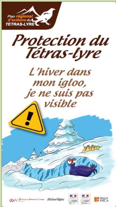
Bâche n° 1 « Igloo »