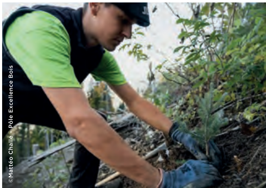
© Mattéo Challe - Pôle Excellence Bois

L'association forme, informe et défend l'intérêt des élus dans leur rôle de propriétaire forestier et d'aménageur du territoire, de maître d'ouvrage public, et de médiateur. Elle a pour vocation de représenter, conseiller et accompagner les élus des collectivités locales sur l'ensemble des questions liées à la forêt, sa gestion et aux activités induites. Elle cherche à améliorer, développer et valoriser le patrimoine forestier des collectivités pour promouvoir une gestion