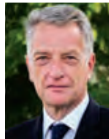
Hervé Gaymard Président du Conseil départemental

Attaché au patrimoine forestier le Département de la Savoie, accompagné de tous les acteurs socio-économiques, souhaite prendre toute sa part pour la préserver, car comme chacun l'aura compris, en matière forestière il faut agir pour conserver.