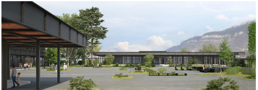
Vue architecte du projet de réhabilitation du collège de Bissy ©Patey architectes

Enfin, 7,1 M€ de travaux de maintenance sont programmés en 2024, un record depuis 10 ans ! 39 % de cette enveloppe budgétaire, soit 2,8 M€, sont consacrés au développement durable : depuis la sobriété énergétique des bâtiments jusqu'au plan vélos des collèges qui a lui seul représente 405 000 € d'aménagements cette année.