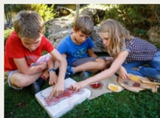
Musées de Savoie