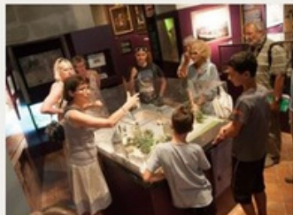
Château des Ducs de Savoie

Animations pour tous les âges, visites libres ou accompagnées par un médiateur, ressources et outils (fiches, livrets de jeux, carnets) pouvant être mis à disposition, partez à la recherche de l'offre qu'il vous faut !